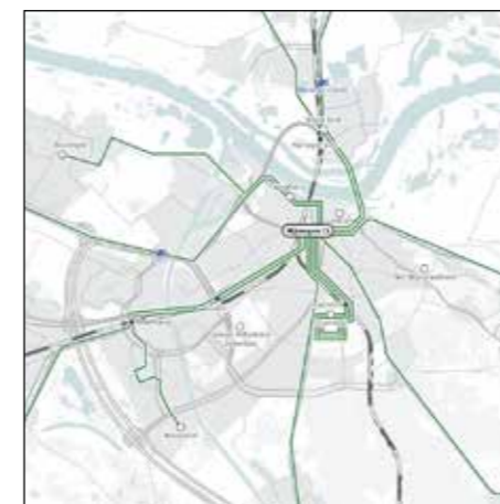
Stedelijk HOV Nijmegen